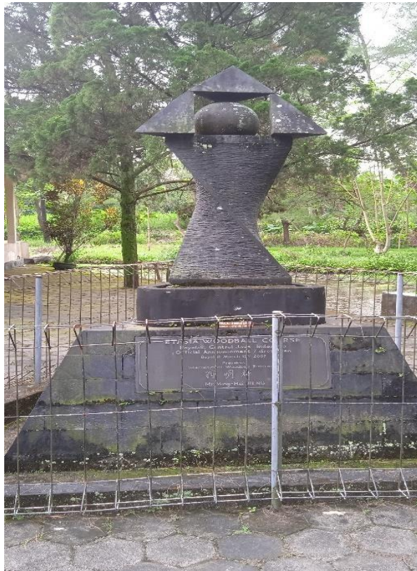
Gambar 3.12 Patung Woodball yang menandai diresmikannya Woodball pertama kali di Indonesia