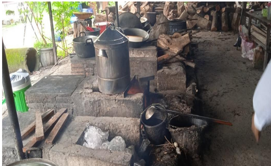
Gambar 3.14 Pawon untuk memasak nasi