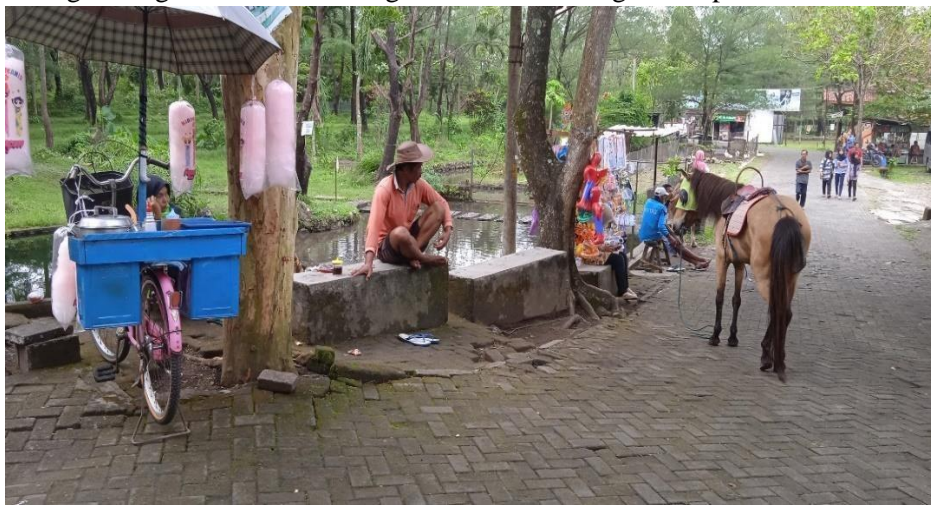
Gambar 3.5 Warga sekitar diperbolehkan berjualan di lingkungan ETASIA

Narasumber atau owner memperbolehkan warga sekitar menjajakan dagangannya di dalam Ekowisata Taman Air Tlatar (ETASIA). Maksud dan tujuan dari narasumber atau owner adalah agar warga sekitar bisa saling membantu meningkatkan perekonomian.