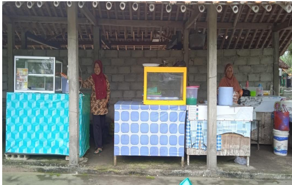
Gambar 3.4 Kios gratis bagi warga sekitar

Narasumber atau owner memperbolehkan warga sekitar menjajakan dagangannya di dalam Ekowisata Taman Air Tlatar (ETASIA). Maksud dan tujuan dari narasumber atau owner adalah agar warga sekitar bisa saling membantu meningkatkan perekonomian.