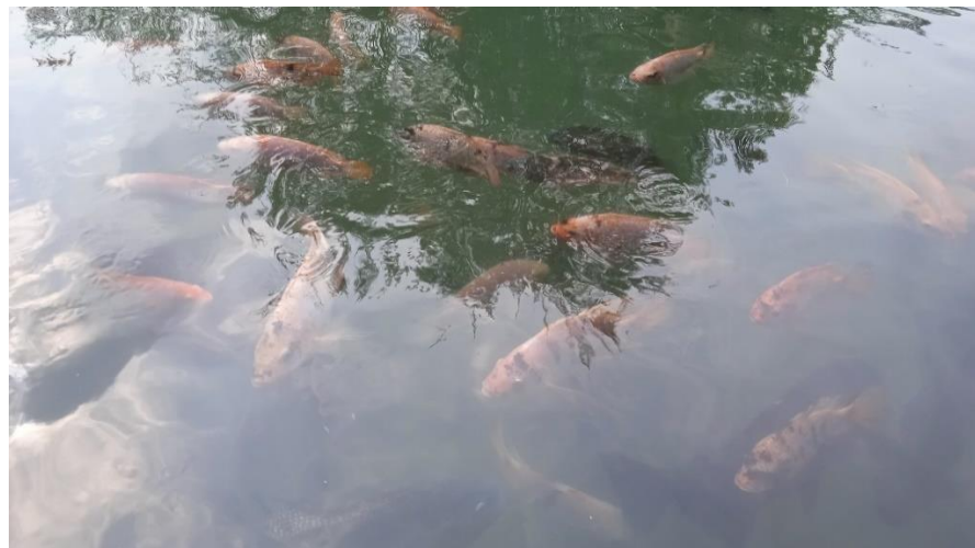
Gambar Gambar 3.16 Ikan segar untuk konsumsi