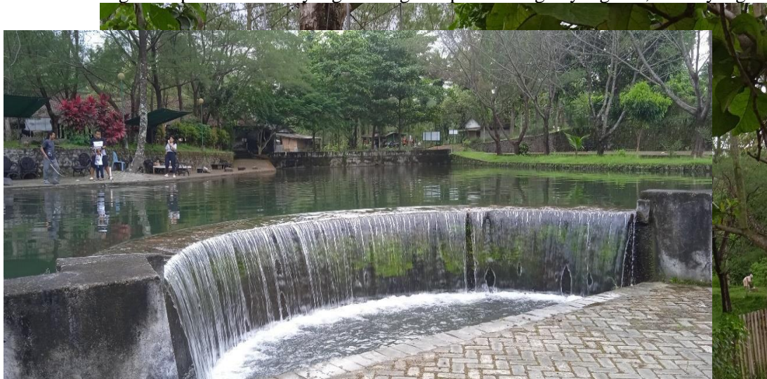
Gambar 3.7 Flying fox yang berada seperti di tengah hutan Dikelilingi oleh pohon cemara yang rindang dan pemandangan yang asri, udara yang

Di samping banyak yang memanfaatkan ETASIA untuk kegiatan outbond, owner atau pemilik atau narasumber juga sangat memperhatikan keasrian dari Ekologi Taman Air Tlatar (ETASIA) dengan cara membuatnya terlihat menyatu dengan alam sehingga bisa diterima oleh pengunjung di segala usia. Seperti tempat flying fox yang berada seperti di tengah hutan, air terjun mini yang langsung dialirkan ke sungai, taman batu yang mereplika pancasila, jalan menuju tempat parkir yang dibuat seperti banjir yang bertujuan untuk membersihkan roda kendaraan, dan lain sebagainya.