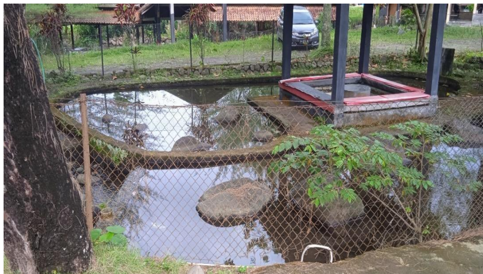
Gambar 3.13 Tempat terapi ikan

Selain itu, narasumber juga menambahkan tempat untuk terapi ikan yang cukup banyak