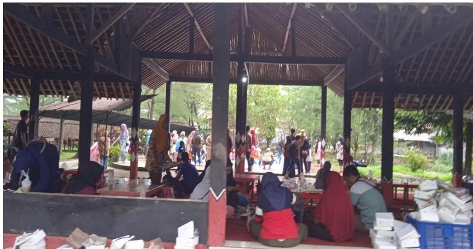
Gambar 3.18 Makan lesehan

Dengan sistem gotong-royong yang diterapkan narasumber atau owner, semakin hari semakin banyak pengunjung yang datang ingin menghabiskan akhir pekan bersama keluarga ataupun bersama teman atau hanya sekedar bersantai. Menikmati pemandangan alam yang asri adalah tujuan dari dibangunnya Ekowisata Taman Air Tlatar (ETASIA) agar wisata Indonesia khususnya daerah Boyolali juga bisa bangkit kembali seperti saat sebelum pandemi.