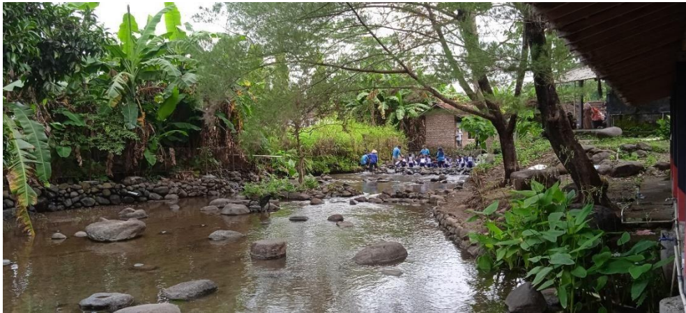
Gambar 3.6 Anak-anak memandikan kerbau

mulai ramai pula ETASIA (Ekowisata Taman Air Tlatar) dikunjungi oleh para wisatawan terutama anak-anak TK yang sangat menikmati segarnya air ETASIA untuk kegiatan outbond, memandikan kerbau hingga makan bersama guru dan orang tuanya di lesehan.