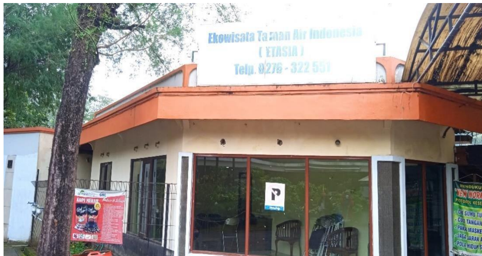
Gambar 3.1 Bagian depan ETASIA

Namun keindahan dari Ekowisata Taman Air Tlatar (ETASIA) seketika sepi oleh pengunjung dikarenakan pandemi yang melanda seluruh dunia terutama di Indonesia. Lonjakan kasus Covid-19 membuat semua destinasi wisata di tutup dalam jangka waktu yang tidak bisa ditentukan hingga membutuhkan waktu 2 tahun bagi Ekowisata Taman Air (ETASIA) untuk bisa bangkit lagi dalam keterpurukan.