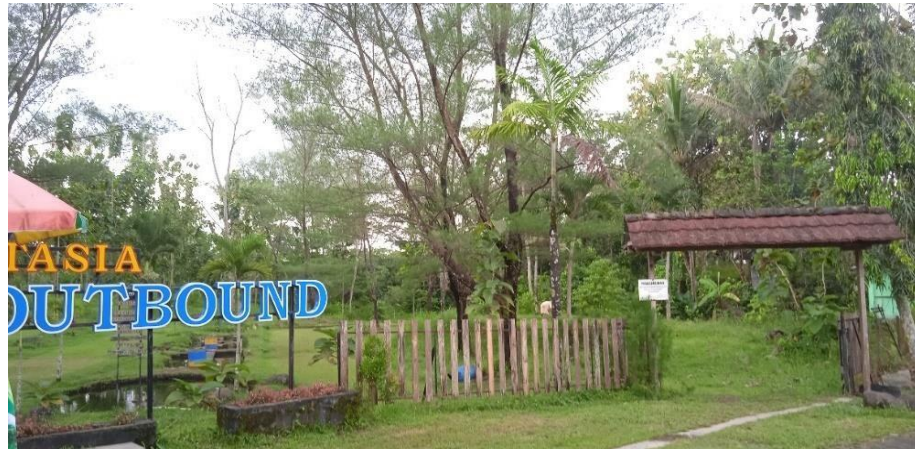
Gambar 3.11 Lapangan Woodball

yang sering takjub dengan konsepnya. Karena banyak yang mengira jika kolam renang tersebut bocor karena adanya aliran air yang terlihat menggenang tetapi sebenarnya memang dibuat seperti banjir dengan air yang mengalir jernih.